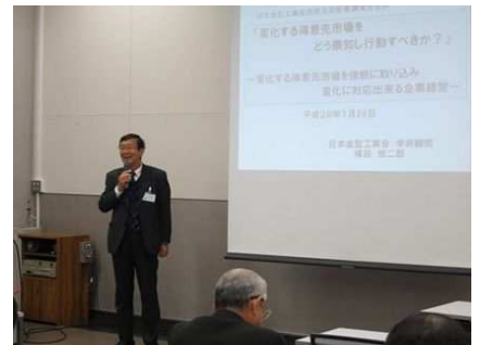
風景= 大阪科学技術センター

新しい時代は 単独企業では生き残れなく、企業どうし連携して高度な戦略を積み上げる必要がある。