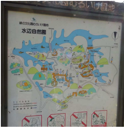
風景= 府民の森ハイキングコースマップ