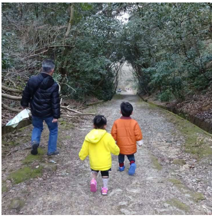
風景=コース途中の下り坂