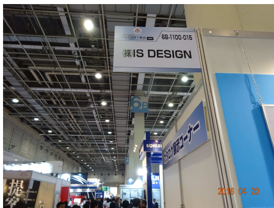
風景= IS DESGN ブース